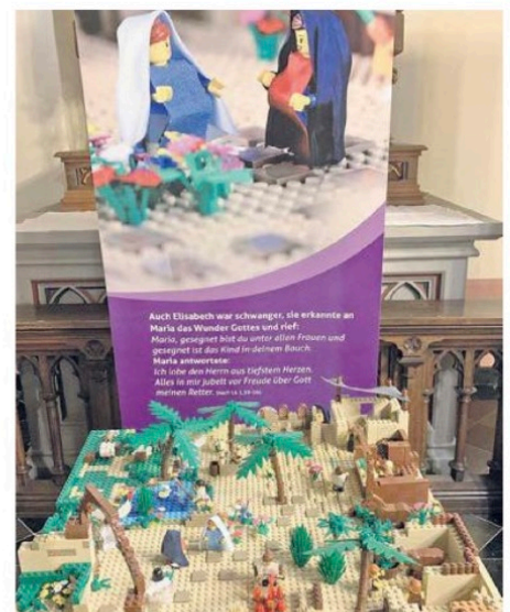
Schautafeln mit Bildern und Bibelzitateln laden zum intensiven Betrachten der Legokrippe ein.