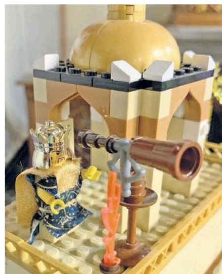
Mit viel Liebe zum Detail haben Helferinnen und Helfer die kleinen Figuren ausgestattet.