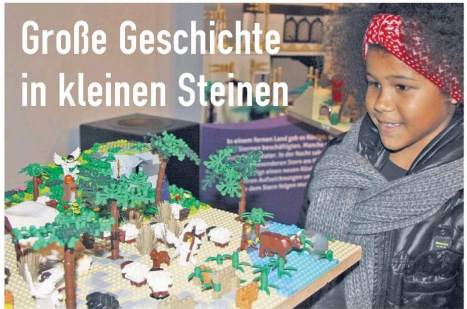
Besonders Kinder erfreuen sich an der Krippe aus Legosteinen.

Mit zum Erfolg trägt sicherlich die große Liebe zum Detail bei, die einem an jeder der acht Stationen ins Auge springt. Sechs Schneiderinnen waren wochenlang damit beschäftigt, die Miniatur-Kostüme in Kleinarbeit anzufertigen. Die genaue Anzahl der verbauten Steinchen kann Ende nicht nennen. Jedenfalls musste man zweimal zu einem Händler nach Mettmann fahren und kiloweise gebrauchte Bausteine kaufen. Und dann waren noch Zukäufe im Internet und bei Legobörsen notwendig. Am schwierigsten