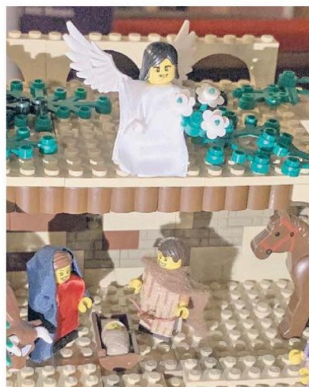
Ständige Begleiter der Menschen sind die Erzengel in jedem der acht Schaubilder zur Weihnachtsgeschichte.