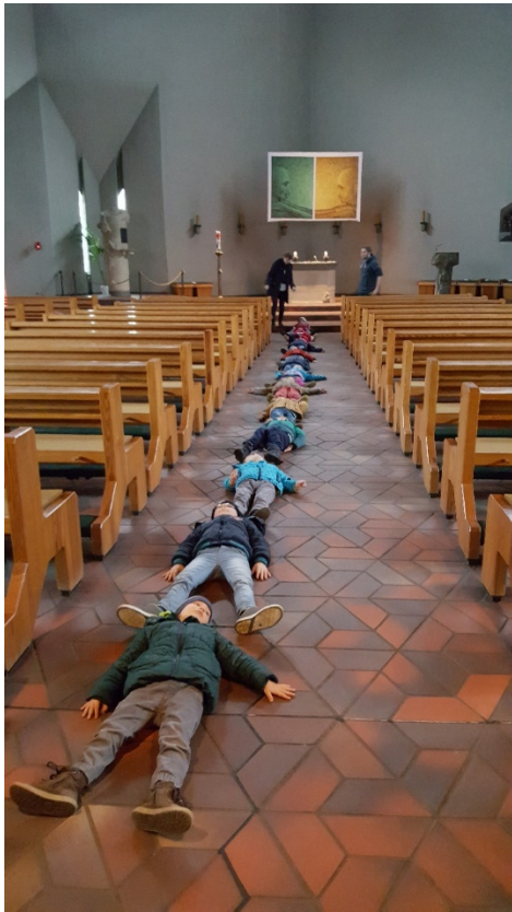
22 ½ Kinder

Dann haben wir auch gezählt, wie viele Kinder wir benötigen, um zu sehen wie lang die Kirche ist. Wir haben uns alle hintereinander gelegt: